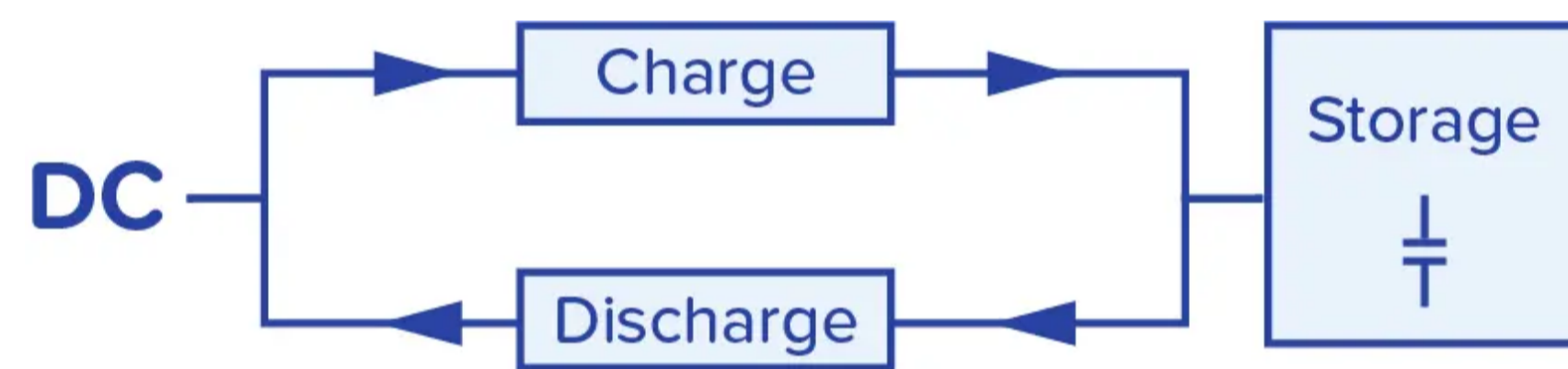
Principio de funcionamiento de un módulo de búfer

Con la ayuda del módulo de búfer, las máquinas y los sistemas pueden equiparse fácilmente para su uso en redes inestables en todo el mundo.