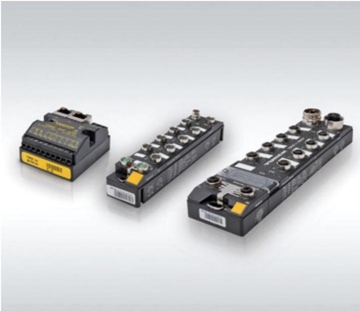
Herramientas de la Industria 4.0: Las series de módulos de E/S FEN20, TBEN-S y TBEN-L de Turck no solo son adecuadas para el funcionamiento multiprotocolo, sino que también pueden utilizarse como controladores lógicos flexibles inteligentes (FLC).