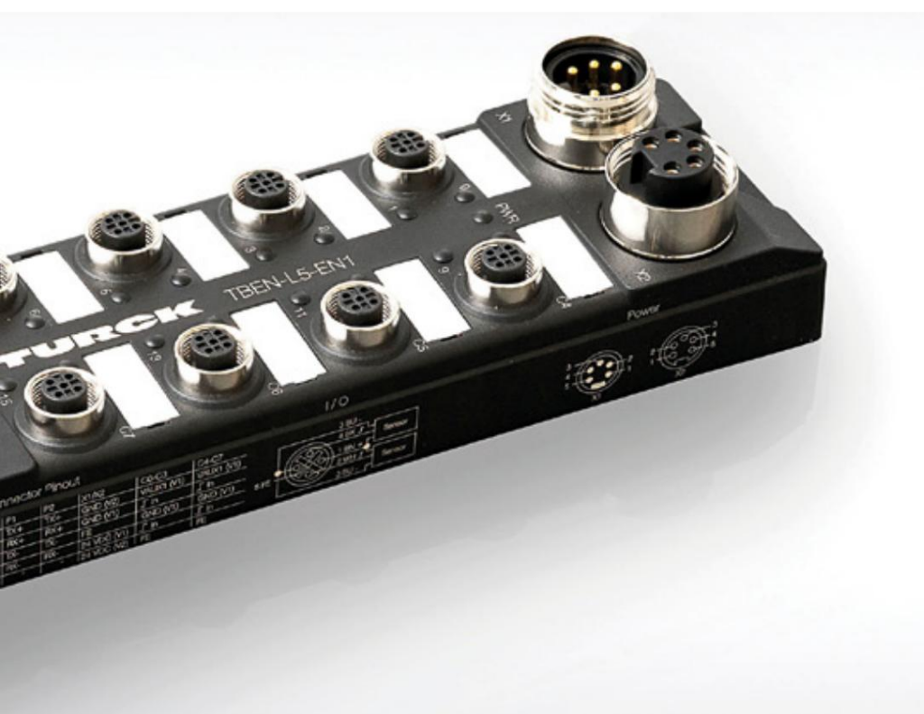
El módulo de llave TBEN-L5-EN1 funciona como esclavo para ambos controladores y, por lo tanto, permite la conexión directa. comunicación maestro-maestro. Gracias a su Tecnología multiprotocolo, funciona en Profinet, Redes EtherNet/IP y Modbus TCP

Los requisitos simples también se pueden implementar en los módulos de E/S del bloque Turck de forma completamente autónoma con ARGEE. El adicional